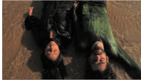
هدف المهرجان طرح قضايا إنسانية في سعي لمعالجتها

اللقاءات التي تجربها شاكاروفا مع النساء تكشف عن معاناتهن النفسية التي لا تتوقف حتى بعد التخلص من "الدين" المفروض عليهن والعودة الى قراهن.